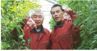
东热番茄农场 - 城也太社长与顺二董事长

东热成立于1981年，是一家重点的工业炉制造商。该公司不仅位于日本，还在中国、印度和泰国驻点。