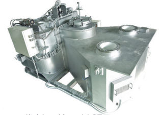
下一代低压炉 - ALST

是授权我们的专利，”望月先生解释说，“我们希望我们的专利扩展到许多国家，让更多的公司使用我们授权的专利。”